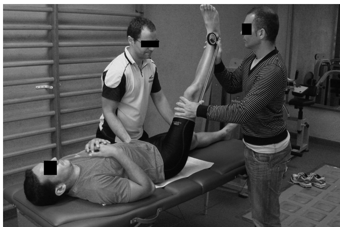
Fig. 2. Prueba pasiva de elevación de la pierna recta medida con inclinómetro, explorador auxiliar y soporte lumbar.

Fisk 31 sugiere la utilización de dos exploradores de forma que uno de ellos realiza la prueba y mantiene la pelvis fija con la mano en la espina iliaca antero-superior y el otro efectúa la medición. Santonja et al. 6,10 han descrito y diseñado un soporte lumbar o “Lumbosant”, estructura rígida que se coloca en la región lumbar amoldándose a la curva lordótica y evitando su inversión y la basculación de la pelvis.