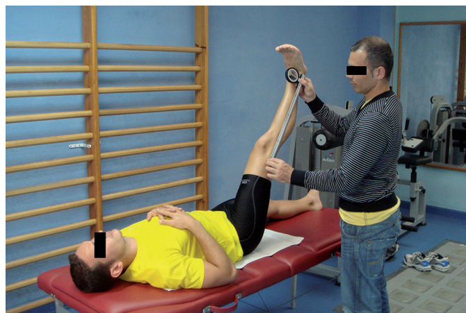
Fig. 1. Prueba pasiva de elevación de la pierna recta medida con inclinómetro.

La prueba EPR estima la flexibilidad de la musculatura isquiosural a través del ángulo de la flexión de cadera con rodilla extendida. En este sen-