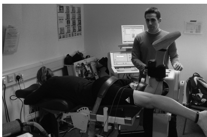
Fig. 2. Posición de valoración en decúbito prono con cadera fijada a 0^\circ de flexión y cabeza en posición neutra.

En cada sesión experimental, únicamente la pierna dominante fue evaluada 54 . Todos los participantes adoptaron como posición de valoración la de decúbito prono sobre la camilla del dinamómetro con cadera fijada a 0^\circ de flexión y cabeza en posición neutra (fig. 2) 55,56 . La posición de tendido prono ( 0^\circ de flexión de cadera) fue seleccionada en lugar de la extensivamente utilizada posición de sentado ( 80 - 110^\circ de flexión de cadera) por dos razones principales: